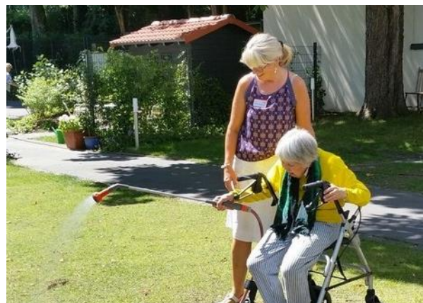
Abbildung 8: Fortführung des gewohnten Tagesablaufs

Das Krankheitsbild erfährt einen Wandel. Durch die Re-Integration Erkrankter und den beiläufig-alltäglichen Umgang mit ihnen werden Berührungängste reduziert. Das StattHaus legt viel Wert darauf, nicht als Pflegeeinrichtung wahrgenommen zu werden, sondern