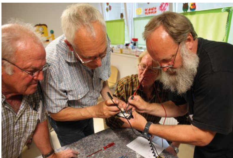
Abbildung 6: Reparieren statt kaufen: Repair Café Speyer

Ein Projekt, das bislang kaum Erwähnung fand, ließe sich auch dem folgenden Typ zuordnen. In Speyer gab es auch aufgrund bestehender anderer Projekte, z.B. eine auch als Veranstaltungsort genutzte Quartiersmensa, bereits viele Anknüpfungspunkte im Quartier die durch das Programm „Anlaufstellen für ältere Menschen“ um ein Repair-Café und eine Taschengeldbörse ergänzt wurden. Beide Ansätze bringen Menschen in un-