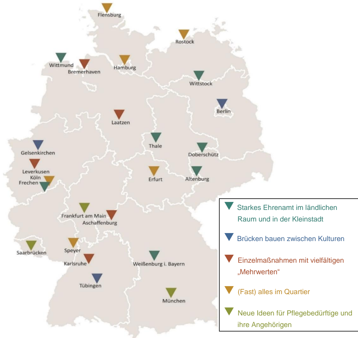
Abbildung 2: Verortung der ausgewählten Projekte

Bei der Auswahl der Projekte wurde eine ausgewogene räumliche Verteilung über das Bundesgebiet angestrebt. Die Anzahl ausgewählter Projekte pro Bundesland orientiert sich – soweit dies mit inhaltlichen Kriterien in Einklang steht – an der Bevölkerungszahl.